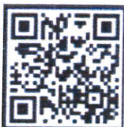
QR Code ใบสมัครฯ

สำนักงานการท่องเที่ยวและกีฬาจังหวัด กลุ่มส่งเสริมและพัฒนาด้านการท่องเที่ยว โทร. ๐ ๕๓๑๑ ๒๓๒๕